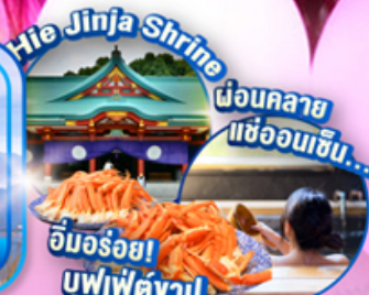
Hie Jinja Shrine