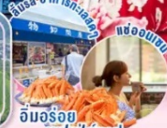
ชิมรสอาหารทะเลสด แฉ้ออนเซน อิมอร์รอย บุฟเฟ่ต์งาปู...