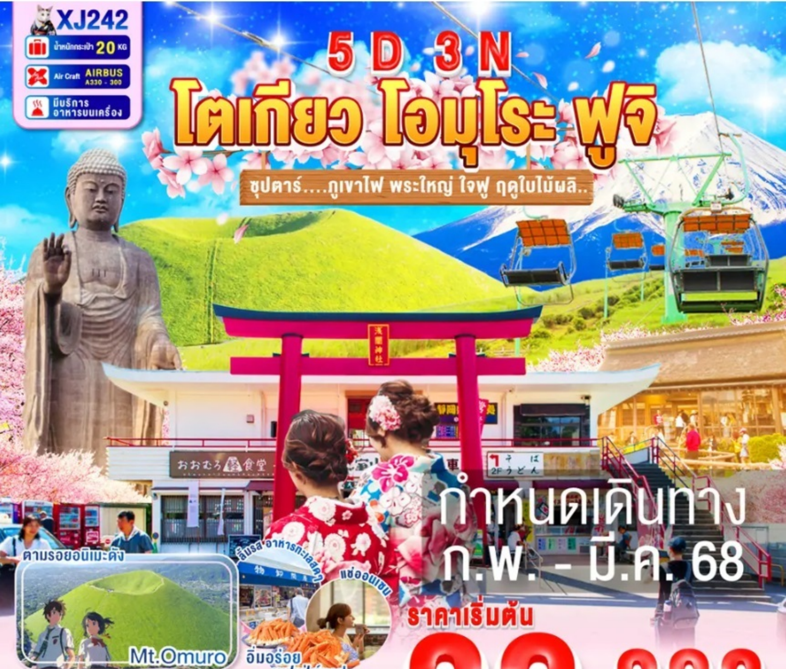
ตามรอยอนิเมะดัง

ชูปตาร์....ภูเขาไฟ พระใหญ่ ใจฟู ฤดูใบไม้ผลิ..