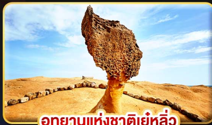
อุทยานแห่งชาติเย่หลิว