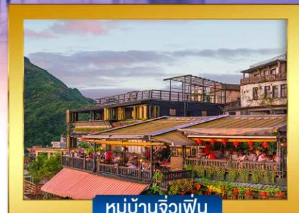
หมู่บ้านจิวเฟิ่น

พิเศษ !! หน่องนึ่งจักรพรรดิ, เสี่ยวหลงเปา, ไอศกรีม MIYAHARA