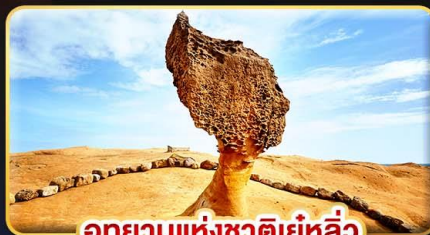
อุทยานแห่งชาติเย่หลิว