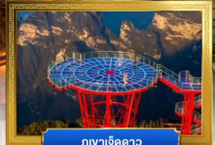
ภูเขาเจ็ดดาว