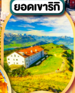
ยอดเขารีกี