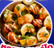
หอยเอสคาร์โก

เดินทาง 11-19 ต.ค.67/ 14-22 พ.ย.67 25 ธ.ค.67 - 2 ม.ค.68(เทศกาลปีใหม่)