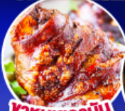
พาหมูเยอรมัน