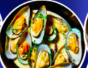
หอยแมลงภู่ออนินทรีย์