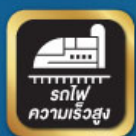
รถไฟ ความเร็วสูง