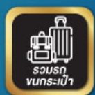
รวมรถ ขนกระเป๋า