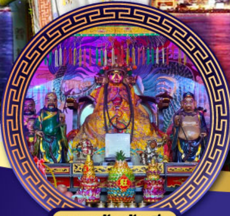
ศาลเจ้าหึงเจีย