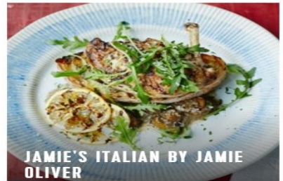
JAMIE'S ITALIAN BY JAMIE OLIVER