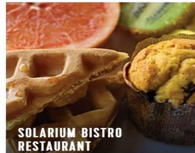
SOLARIUM BISTRO RESTAURANT