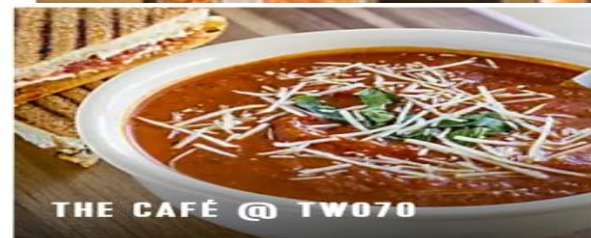
THE CAFÉ @ TW070