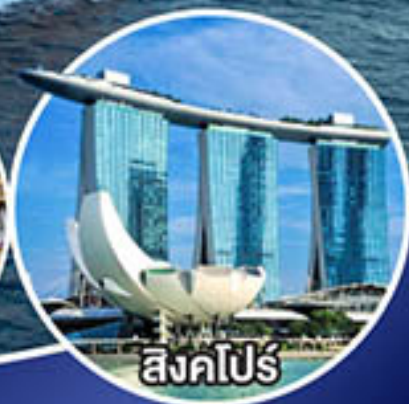
สิงคโปร์