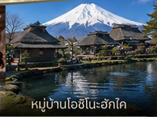
หมู่บ้านโอชิโนะอัครโค