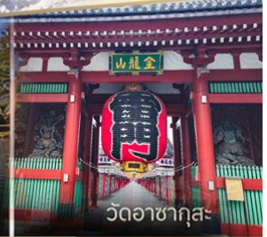
วัดวอดาซากุสะ