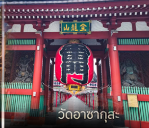
วัดอาสาซุกุสะ