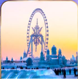
เทศกาลแกะสลักน้ำแข็ง Harbin Ice and Snow Festival