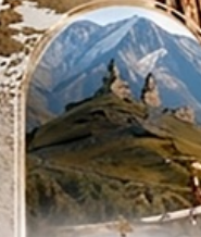
คาสเบกี 4WD EXPERIENCE