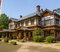
คฤหาสน์ตระกูลโชโตะ