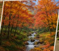
Yahiko Maple Valley ชมใบไม้เปลี่ยนสี