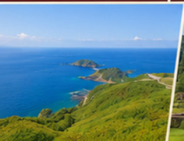
เกาะซาโตะ ไอชาโดสกายไลน์