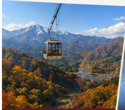
นาเอะ: สกีรีสอร์ท นั่งกระเช้า Dragondola