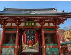
วัดอาซากุสะ โตเกียว