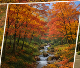
Yahiko Maple Valley ชมใบไม้เปลี่ยนสี