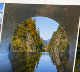
หุบเขาคิโยสึ