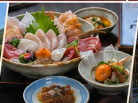
อาหารพรีเมียม เมนูท้องถิ่นและอาหารญี่ปุ่น