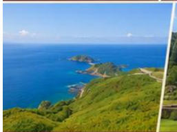
เกาะซาโตะ โอซาโตะสกายไลน์