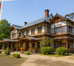
คฤหาสน์ตระกูลโชโตะ