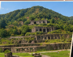
เหมืองทองซาโตะ