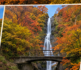
น้ำตกนาเอมะ