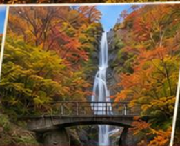
น้ำตกนาเอะมะ