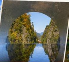
หุบเขาคิโยสึ