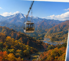
นาอเบะ สกีรีสอร์ท นั่งกระเช้า Dragonodola