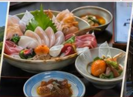
อาหารพรีเมียม เมื่อก่อนต้นและอาหารญี่ปุ่น