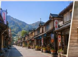
ถนนนุดตาริ