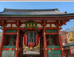
วัดอาซากุสะ โตเกียว