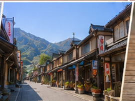
ถนนนุดตาริ