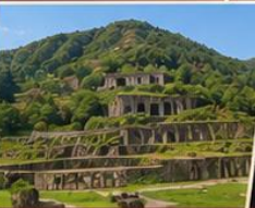
เหมืองทองซาโตะ