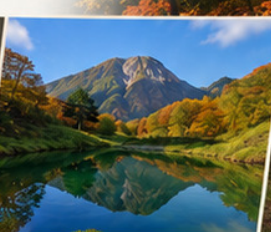
บ่อน้ำจิมโมริ