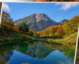
บ่อน้ำจิมโมริ