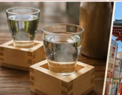
โรงเหล้าสาเก สัมผัสวัฒนธรรมญี่ปุ่น