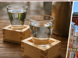
โรงเหล้าสาเก สัมผัสวัฒนธรรมญี่ปุ่น