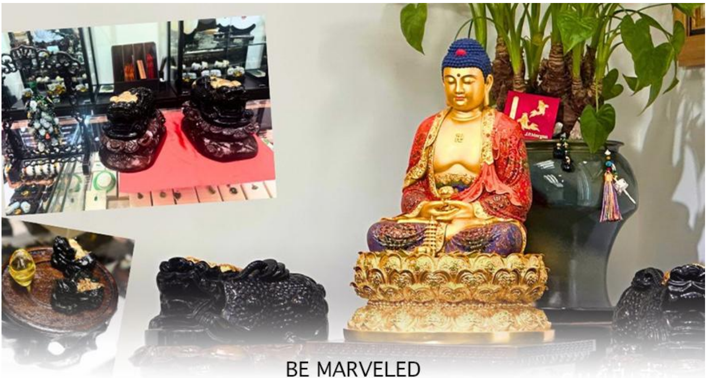
BE MARVELED ศูนยี่ปี่เซี๊ยะ

นำท่านชม ศูนยี่ปี่เซี๊ยะ ซึ่งคนจีนนี้ ถือว่าหยกเป็นหิน ที่เป็นตัวแทนของความสวยงามและความบริสุทธิ์มีความเชื่อว่า หยก มงคล ถ้าพกติดตัวไว้จะอายุยืนและสุขภาพดีมีสินค้ำมากมายเกี่ยวกับหยก อาทิ กำไลหยก หรือสัตว์นำโชคอย่างปี่ เซี๊ยะ ให้ ท่าน ได้เลือกซื้อเป็นของฝาก, ของที่ระลึก หรือของนำโชคแต่ตัวท่านเอง