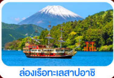
ล่องเรือทะเลสาบอาชิ