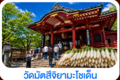
วัดมิตสึยามะไซเด็น