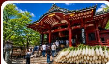
วัดมัตสึจิยามะโชเด็น