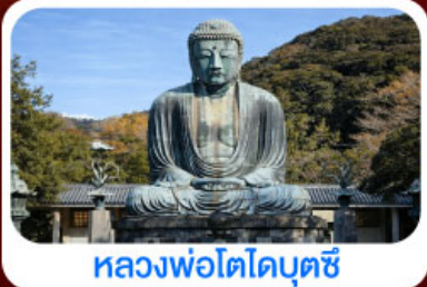
หลวงพ่อดังโตโดบุตซี