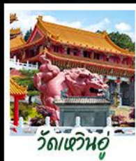
วัดเหวินอู่