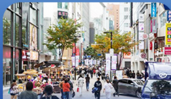
ซ้อปบั้งข่านเม็งงดง