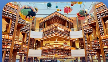
ต๋องสมุคตาร์ทไฟค