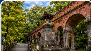
วัดนินเซ็นจิ