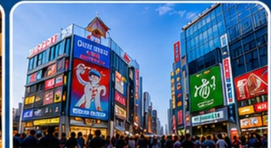
ช้อปปิ้งย่านชินไซบาชิ