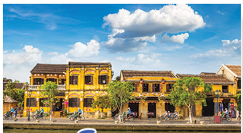
เมืองโบราณฮองอัน