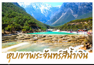
เขื่อนพระจันทร์สีน้ำเงิน