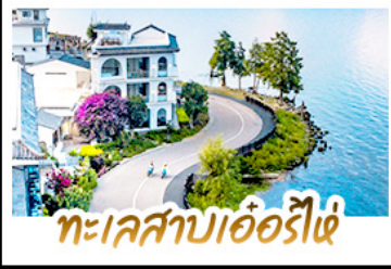
ทะเลสาบเอ๋อร์ไห่

นั่งรถม้าสุดฟิน ชมทุ่งข้าวสีทองเหลืองอร่าม • ถ่ายรูป MOOD ที่ใช้กับวิวทะเลสาบเอ๋อร์ไห่สุดโรแมนติก ชมดอกไม้ตามฤดูกาลกลางขุนเขา ณ สวนอวามู่ฉาง • พืชดกเขาหิมะมังกรหยกความสูงกว่า 4,506 เมตร (รวมกระเช้าใหญ่ ไป-กลับ) • นั่งรถไฟชมวิวภูเขาหิมะมังกรหยกวิวพาโนรามา • จิบกาแฟยามบ่าย พร้อมจิบช็อคอิน วิวหลักล้าน ณ ร้านกาแฟพายุหิมะ (รวมค่าเครื่องดื่มท่านละ 1 แก้ว) • เที่ยวเมืองโบราณต้าหลี่ ลี่เจียฟ ไปซา ชิม ซ้อป แชะ กับวัฒนธรรมยูนนาน • ช้อปปิ้งเพลิน ณ ถนนคนเดินหนานผิงเจียและ POP MART