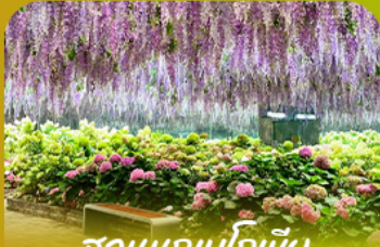
สวนนกเป็ดน้ำ