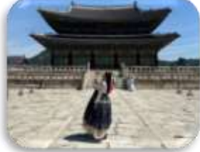
พระราชวังเคียงบก