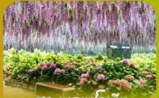
สวนนกเปาเม็ย