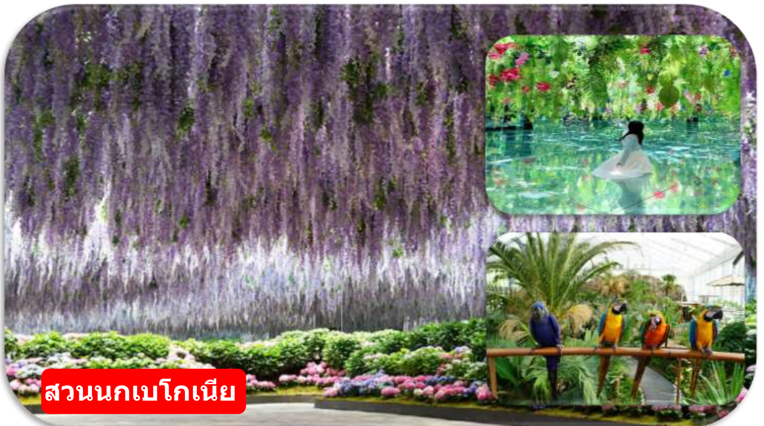
สวนนกเบโกเนีย

สวนนกเบโกเนีย เมืองดาพยอง (Begonia Bird Park) สวนธรรมชาติและเรือนกระจกขนาดใหญ่ที่ผสมผสานโลกของดอกไม้และสัตว์ปีกไว้อย่างลงตัว ภายในสวนจัดแสดง ดอกเบโกเนียหลากหลายสายพันธุ์สีสันสดใสตลอดทั้งปี ให้ท่านจะได้เพลิดเพลินกับการเดินชมสวนดอกไม้ พร้อมใกล้ชิดกับนกสายพันธุ์ต่าง ๆ