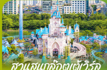
สวนสนุกโลกอเวเจอร์ Lotte Adventure World