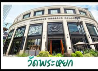
วัดพระหยก