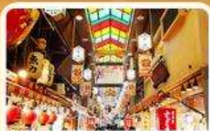
ตลาดปลา นิชิกิ