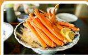
พิเศษ! ชาบู