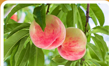
กิจกรรมเก็บผลไม้