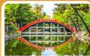
ศาลเจ้าซูมิโยชิ โทคะ