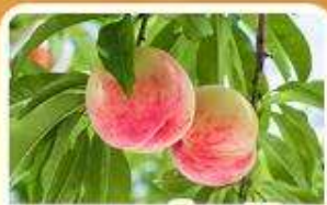
กิจกรรมเก็บผลไม้