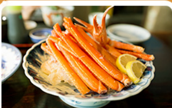
พิเศษ! ขาปู