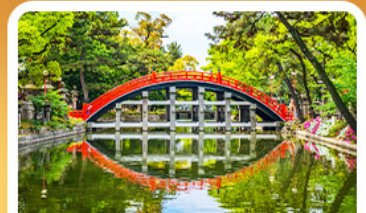
ศาลเจ้าสุมิโยชิ โกะ