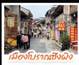
เมืองโบราณเซียงผิง

เช็คอินจุดไฮไลท์กุ้ยหลิน เจดีย์เงินเจดีย์ทอง ไขวงวงช้าง นั่งเคเบิลคาร์สู่ เทาหลูอี้ จุดชมวิวกะลาภูเขา ๓ แห่งเมืองหยางซั่ว ล่องเรือแม่น้ำลู่เจียง ตามรอยช้างหลังภาพรมบัตร 20 หยวน อีสรระซ้อปึงถนนคนเดิน 2 แห่ง ถนนดงซีเซียง ถนนซีเจีย นั่งกระเช้าบอลูนชมวิวแบบ 360 องศา