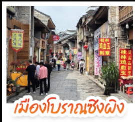
เมืองโบราณเซียงผิง

เช็คอินจุดไฮไลท์ทั่วโลก ทัศนียภาพเจดีย์ทอง เหวงวงช้าง นังเคบิลคาสู เหวหรือ จุดชมวิวกะหลกเวา แห่งเมืองหยางชิว ล่องเรือแม่น้ำลี่เจียง ตามรอยช้างหลังกาพรนบัตร 20 หยวน อิสระช้อปปิ้งถนนคนเดิน 2 แห่ง ถนนดงซีเซียง ถนนซีเซียง นังกระซิบอลูนชมวิวกแบบ 360 องศา