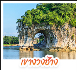
เขาวงวงช้าง