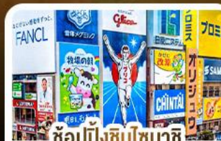
ช้อปปิ้งชินโซบาชิจิ และโดตันโบริ