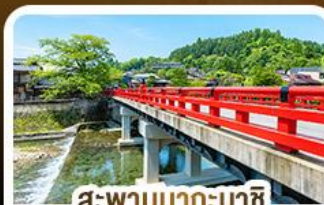
สะพานนากะบาชิจิ ทาคายาม่า