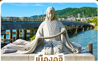
เมืองอูจิ สวรรค์คนรักชาเขียว

คามิโคจิ สวรรค์บนดินแห่งเทือกเขาแอลป์ ชมสะพานคิปปาบาชิ ชมวัดเนียวโดอิน • เมืองทาดายาม่า • ตลาดปลานิชิกิ • ช้อปปิ้งชินโซบาชิ • อีออนมอลล์