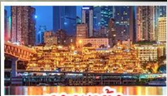
แดงเซาตั้ง