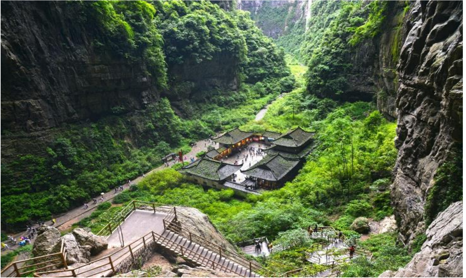
กลางวัน รับประทานอาหารกลางวัน ณ ภัตตาคาร (เมื่อที่ 5)

บ้ำรุงหรือจากสภาพอากาศที่ไม่อำนวนย บริษัทฯ คำนึงถึงความปลอดภัยของท่านเป็นสำคัญที่สุด จึงขอสงวนสิทธิ์ในการปรับเปลี่ยนโปรแกรมการท่องเที่ยวให้เหมาะสมกับสถานการณ์ โดยอาจจัดหาโปรแกรมอื่นมาทดแทน ทั้งนี้ การเปลี่ยนแปลงดังกล่าวอยู่นอกเหนือการควบคุมของบริษัทฯ จึงไม่สามารถคืนเงินค่าบริการในส่วนนี้ได้ โดยบริษัทฯ จะยึดตามประกาศจากทางอุทยานฯ เป็นสำคัญ