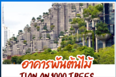
อาคารพันต้นไม้อาณาจักร TIAN AN 1000 TREES