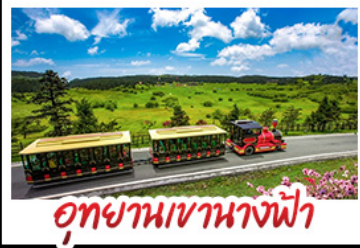
อูทยานเขานางฟ้า

พระพุทธรูปแกะสลักหินตำจู้ - อูทยานลุมบ่อฟ้า อูทยานเขานางฟ้า - ดิกขุยซิง ซัน 22 - อูทยานน้ำผึ้งโกว สะพานโบราณหนาน - รถไฟรถไฟฟ้าทะเลตึก ถนนโบราณชอยกวางชอยแคบ - หงหยาดัง วัดต้าฉือ - ถนนคนเดินซุนซู่