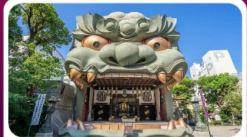
ศาลเจ้านัมมะ ยาชากะ