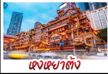
ตงเซยาตั้ง

อุทยานหลุมบ่อฟ้า - อุทยานเทานางฟ้า หงหยาดัง - นิ่งรถไฟทะเลสาบ - อุทยานสี่ดรุณี ปี่ผิงโกว - สะพานหนานเฉียว