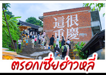
ตรอกเขี้ยวฮ่าวหลี่