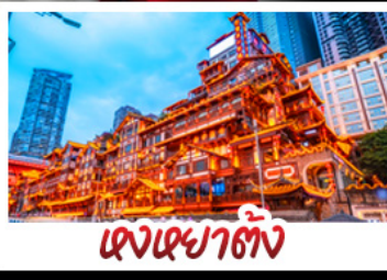
แดนเฉิงชิ่ง