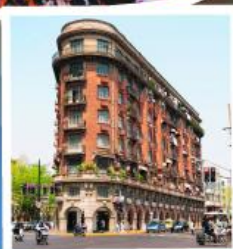
ถนนอุ๊คัง