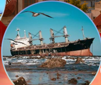
เรืออัปปาง Blueways