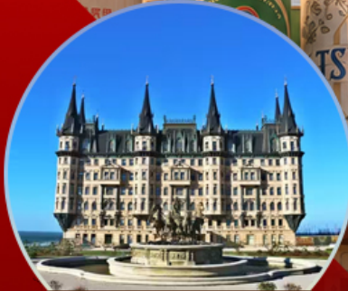
คฤหาสน์เวินเจิง