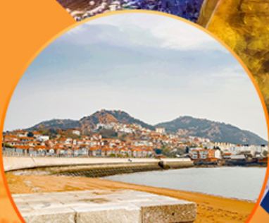
ซาจื่อโป่ว