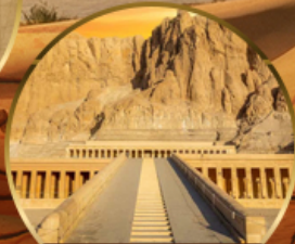
หุบเขากษัตริย์