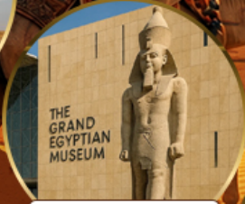
พีพีรภัณฑ์แกรนด์อียิปต์