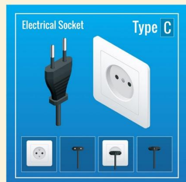
ปลั๊กไฟที่ใช้ที่อียิปต์