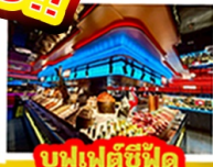
บุฟเฟ่ต์ซีฟู้ด