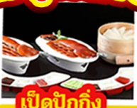
เปิดบ๊ักกิ้ง