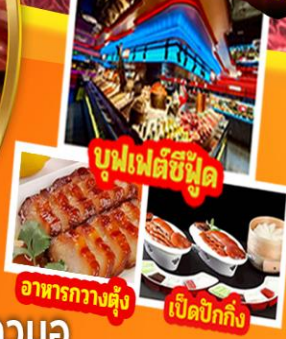
บุฟเฟต์ซีฟู้ด