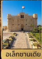
อเล็กซานเดีย