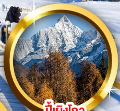
ปี้เิงโกว