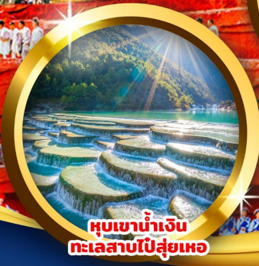
หุบเขาน้ำเงิน ทะเลสาบโป๋ส่วยเหอ