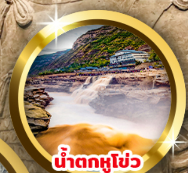
น้ำตกหูโข่ว