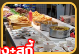
เปิดอย่าง+สุดกิ๊