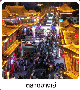
ตลาดจางเย่