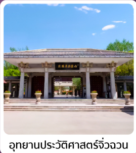
อุทยานประวัติศาสตร์จี้จวงวน

อาหารมื้อพิเศษ ใต้ต้นหม้อไอน้ำ ซีโครงหม้อสโตลิกันโจว