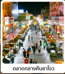
ตลาดกลางคืนซาโจว

ไฮไลท์! ภูเขาสายรุ้งจากเขตนีเสี่ยภูเขาหลากสีสุดมหัศจรรย์ของจีน ถ้าไปเกาตุมรดกโลกแห่งเส้นทางสายไหมอายุเก่าแก่กว่า 1,000 ปี