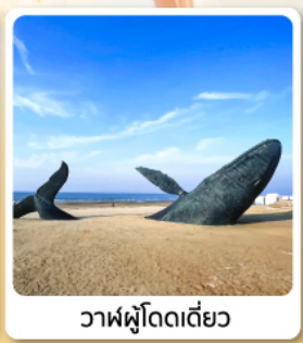
วาฬผู้โดดเดี่ยว