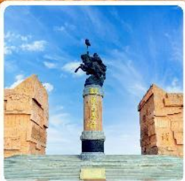
เขตท่องเที่ยวจงกิสข่าน