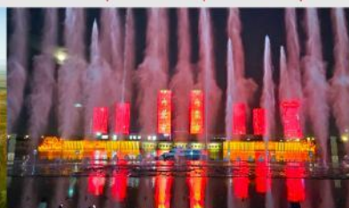
น้ำพุคังปาสือ