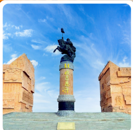
เขตท่องเที่ยวเจงกิสข่าน