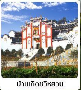
บ้านเกิดชวีหยวน