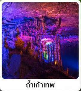
ถ้ำเก้าทง