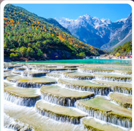
ทะเลสาบไป๋ส่วยเหอ