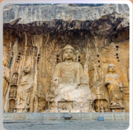
กำแพงเหลืองหิน