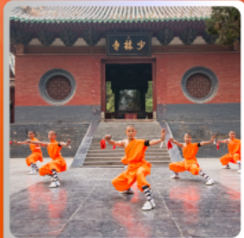
โชว์กังฟู

อาหารมื้อพิเศษ บุฟเฟ่ต์ สุกี่หม้อไฟ เปิดปิกกิ้งซีอาน