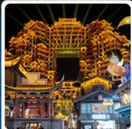
ตึกหัตถจารย์ 72